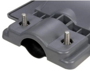
Estructura de ABS y aluminio Clasificación IP65 resistente a exteriores