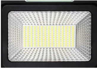
Chip LED de alta potencia SMD EPISTAR 2835