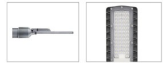
Dust-free and concise