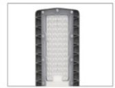
Excellent photometric design