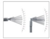
Maximum 30 degrees tilting