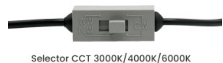
Selector CCT 3000K/4000K/6000K